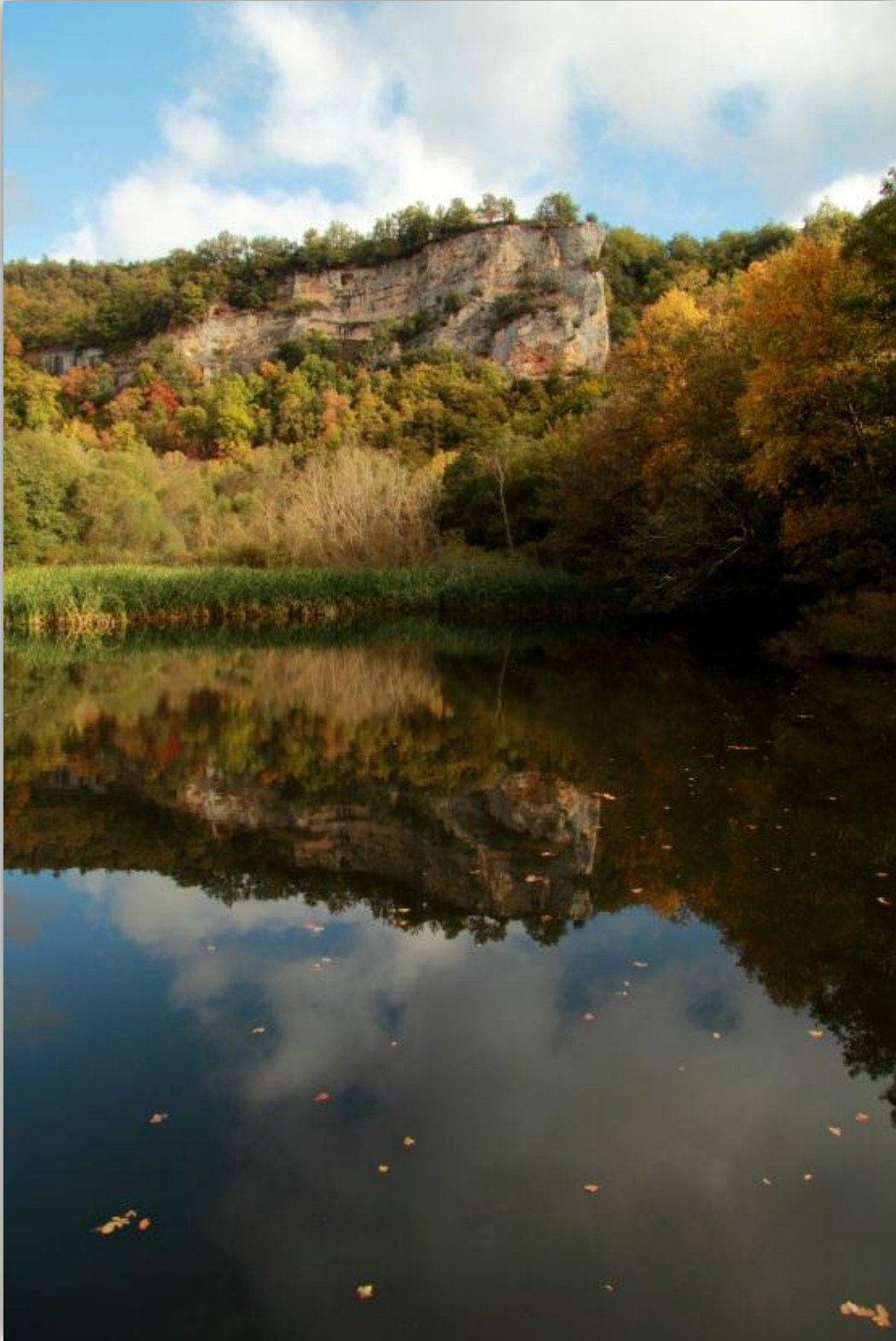
Mirador de Antoñana